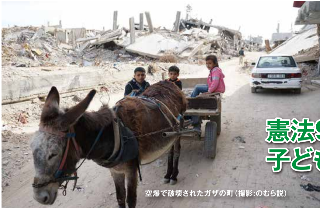
空爆で破壊されたガザの町